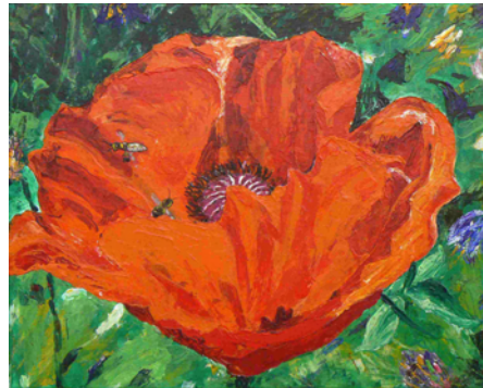
Bild einer Kursteilnehmerin

Voller Begeisterung werden Sie am Ende Ihre Kunstwerke mit nach Hause nehmen.